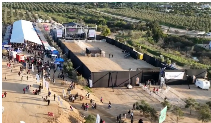
IMAGEN REFERENCIAL DE ESPACIO

Todo el frente del escenario hasta sala de control (FOH) debe quedar debidamente protegido con vallas papales, dejando un pasillo técnico en el centro. En la parte posterior del escenario debe quedar protegido con vallas papales (zona de buses o vehículos artistas y producción técnica).